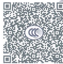
ABB Stotz-Kontakt GmbH (生产者) 及北京ABB低压电器有限公司(生产者授权代表) 确认知晓《强制性产品认证自我声明实施规则》以及相关产品强制性认证实施规则的要求, 对本声明承担全部法律责任。

ABB Stotz-Kontakt GmbH (生产者) 及北京ABB低压电器有限公司(生产者授权代表) 声明以下产品已按照《强制性产品认证自我声明实施规则》以及相关产品强制性认证实施规则的要求进行检测, 符合相关标准要求; 自本声明签署之日起, 生产和销售的产品持续符合以下标准与实施规则的要求; 保存本声明涉及的技术文档至少10年; 正确使用强制性产品认证标志; 如产品或其符合性信息发生变更, 将及时更新技术文档并报送产品变更信息。